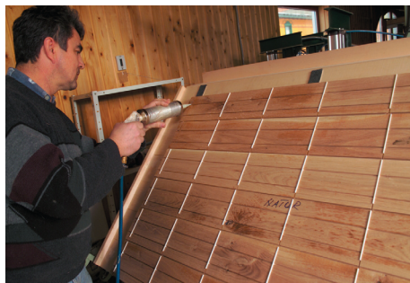
Kunststoffstäbe vermeiden störende Fugen

Um die Bildung störender Fugen zu vermeiden, wurde das patentierte Stabilisierungssystem entwickelt. Heißt im Klartext: Auf der Rückseite des Parketts werden sieben glasfaserverstärkte Kunststoffstäbe quer zur Faser eingearbeitet und mit einem PU-Kleber eingeklebt. Diese Stäbe weisen eine Zugfestigkeit auf, die sechs Mal über der von Stahl liegt und diese Kombination sorgt für einen ruhiggestellten Boden. Und gut fürs Raumklima sind die Massivböden obendrein. Denn die Oberfläche wird mit einem speziellen Öl behandelt.