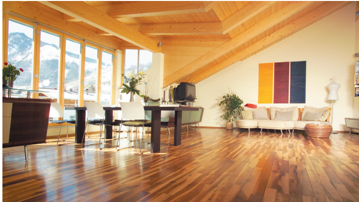
Ein massiver Parkettboden verleiht jedem Raum eine gemütliche Atmosphäre.

Heute ist fast alles möglich, sogar Swarovski-Kristalle lassen sich auf besonderen Wunsch, in die Böden einarbeiten. Die Parkettmanufaktur Deisl gehört zu einer erlesenen Auswahl, die dieses Lifestyle-Produkt erzeugen darf.