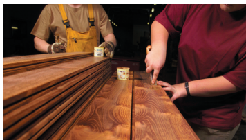
Handverlesen und einzigartig

Wer einen Original-Deisl bei sich zu Hause haben will, muss sich aber erstmal durch ein riesiges Bretter-Lager kämpfen, denn fertige Böden gibt es keine. Jedes Brett wird erst gehobelt wenn ein Käufer dafür gefunden wurde. Dafür ist die Auswahl entsprechend groß. Ob Ahorn, Akazie, Apfel, Birne, Hainbuche, Merbau, Teak oder Zwetschke - verlegt wird, was der Kunde wünscht. Die Fertigung des Bodens nimmt ca. 2 Wochen in Anspruch - schließlich wird alles selbst gemacht. Die Massivholzböden haben eine Stärke von 15 bzw. 20 mm und eine effektive Nutzschicht von 8 mm. Auch dem Argument, dass Holz lebt und sich im Laufe der Zeit ausdehnen kann, können